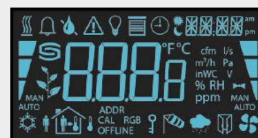
Символы RYMASKON® 200 - Modbus на дисплее